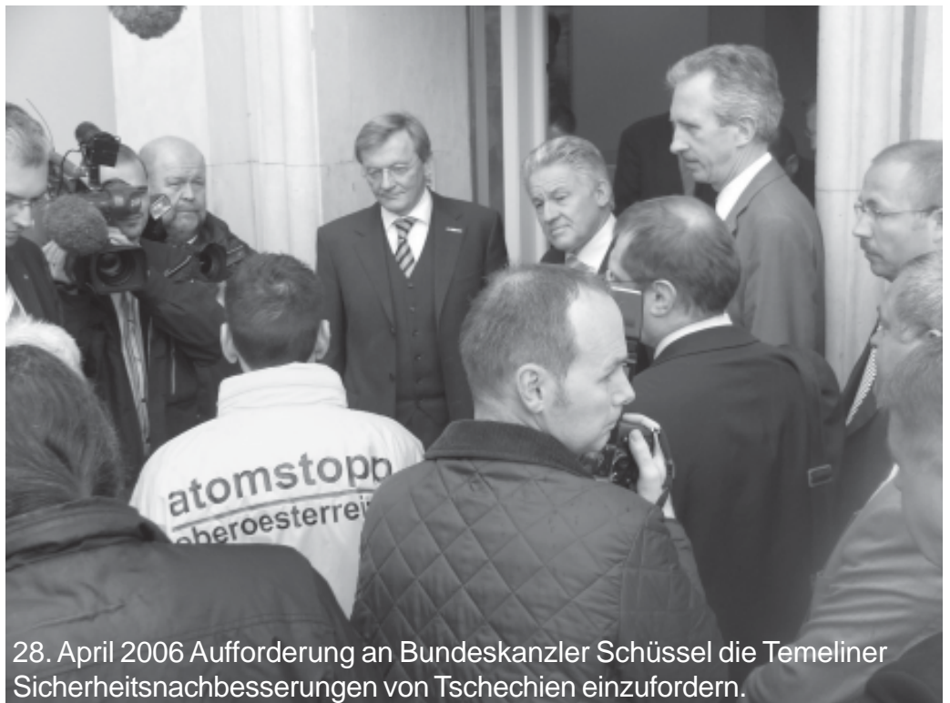
28. April 2006 Aufforderung an Bundeskanzler Schüssel die Temeliner Sicherheitsnachbesserungen von Tschechien einzufordern.