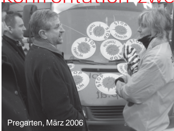
Pregarten, März 2006

Wir haben nicht gefragt, ob wir den Radau schlagen dürfen. Wilhelm Molterer sicherte uns bei konfrontation eins im Jänner 2006 einen Termin mit der Bundesregierung zu den ungelösten Sicherheitsfragen im AKW Temelin zu. Einen Termin, der bereits im September 2005 beim Anti-Atom-Gipfel des Landes OÖ eingefordert wurde. Bundeskanzler Schüssel stand für solch einen Termin allerdings nicht zur Verfügung.