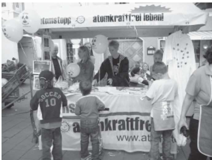
atomstopp_Infostand in Ottensheim, Oktober 2005