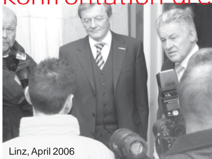
Linz, April 2006

April 2006: Und dann der Bundeskanzler persönlich. Linz. Laut war es (siehe editorial) – aber eigentlich überhaupt nicht konfrontär. Der Bundeskanzler sprach drei Sätze (oder weniger?) und entschwand. Auf Diskussionen zu den ungelösten Sicherheitsfragen im AKW Temelin wollte er sich nicht einlassen. Zu viele Fernsehkameras? Zu viele Journalisten? Der Umweltminister wird es schon richten. Den Schlüssel für den Blockade-LKW wollte er ebenfalls nicht übernehmen. Nein, er habe keinen Führerschein dafür. Also bleibt das Konfrontationsmittel „Grenz-Blockade“ bei uns.