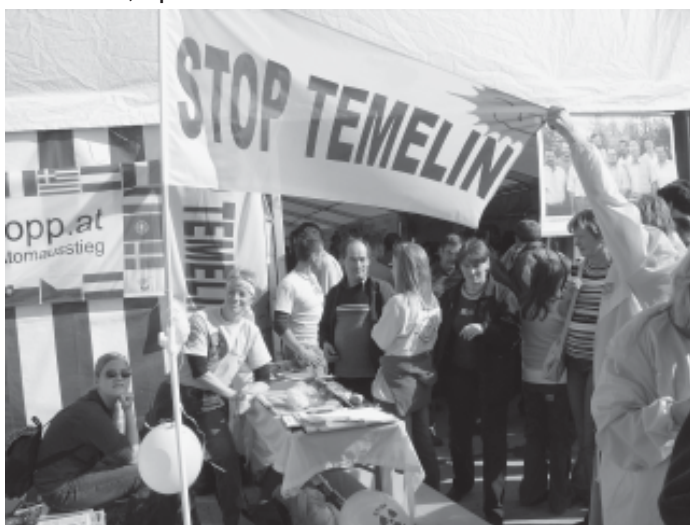
atomstopp_oberoesterreich beim Fest „10 Jahre Windkraft in Österreich“, Eberschwang, Mai 2006